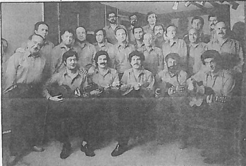
Η λαϊκή χωριάδια Γιωργαλλέτου

Η πρωτοβουλία αυτή του Δημάρχου Α. Χ' Παυλου είναι μια καλή αφετηρία πιστεύω για πολιτιστικές ανταλλαγές.