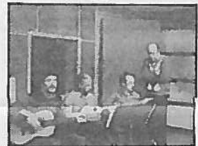
Κιάρες και μαντολίνα στην πρόβα.

γορο να παρακολουθεί κανείς το Βιογραφικό της χωριάδιας ΓΙΩΡΓΑΛΛΕΤΟΥ, που με διαιτητική πρωτοβουλία μεταφέρθηκε επί 43 χρόνια να διατηρείται όμορφη, ρομαντική και σπερμική παρ' όλες τις οικονομικές και άλλες αντιξοότητες που αντιμετωπίζει.