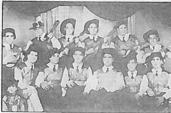
Η χωριάδια Γιωργαλλέτου το 1955

Ενας ταλαντούχος μουσικός που έπαιξε με τόση μαεστρία το μαντολίνο του, την κιάρα του και το παλιό άσματος άργουνο που τα τελευταία χρό-