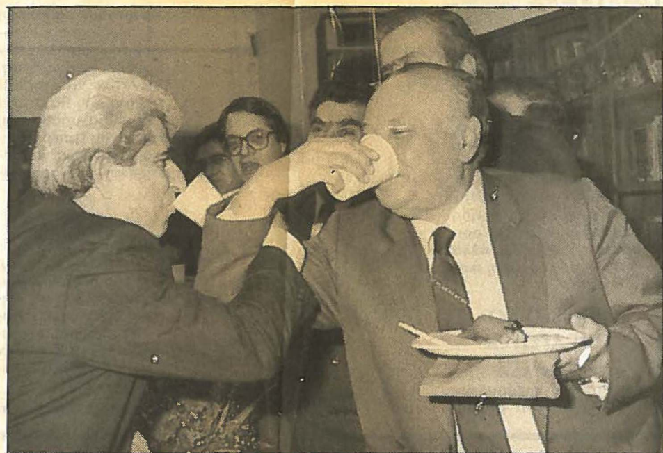
Το ...τεκμήριο του ιστορικού συμβιβασμού