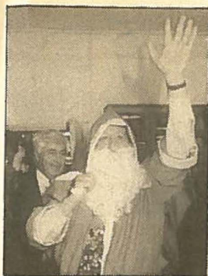
Ο Αησ Βασίλης... ξεπέζεψε από το ποδήλατο του και οδεύει προς το βάθρο για να μοιράσει τους μπονανάδες του

Ι ΣΤΟΡΙΚΗΣ σημασίας εξελίξεις που ανατρέπουν άρδην όλα τα δεδομένα αναφορικά με τις προοπτικές των επικείμενων προεδρικών εκλογών σημειώθηκαν χθες στη Βουλή των Αντιπροσώπων. Τα γεγονότα που διαδραματίστηκαν χθες κατέγραψε επιτελείο συντακτών μας. Συγκεκριμένα: