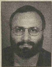
Του Χρήστου Γεωργίου

« Α κόμη και ο Ανδρέας Ζιαρτίδης μιλούσε με τα καλύτερα λόγια για τον Τάσο Παπαδόπουλο», ανέφερε σε πρόσφατη προεκλογική συγκέντρωση στον Αγιο Δομέτιο ο γενικός γραμματέας του ΑΚΕΛ Δημήτρης Χριστόφιας. Ο ηγέτης του ΑΚΕΛ θυμήθηκε τον πατέρα του συνδικαλιστικού κινήματος της Κύπρου, τον οποίο εκπαράθυρωσε με συνοπτικές διαδικασίες από την ΠΕΟ, με στό-