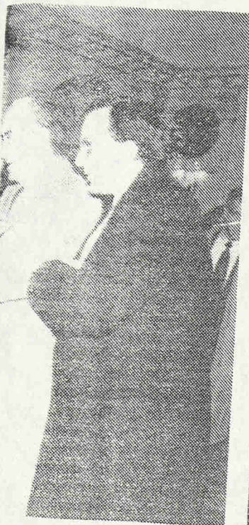
Αντώνης Σαμαράς και άλλα μέλη της ομογένειας μετά την άφιξή τους στην Αθήνα. Φορούν τα ρολόγια του Σαμαράς και ομιλούν για την Κύπρο.

Αυτή όμως η αναθέρμανση πρέπει να συντηρείται συνεχώς και με όλα τα μέσα. Κι εδώ είναι οι μεγάλες ευθύνες της ομογένειας, των οργανώσεων της, των αξιολογικών παραγόντων που την συνθέτουν, αλλά και όλων των