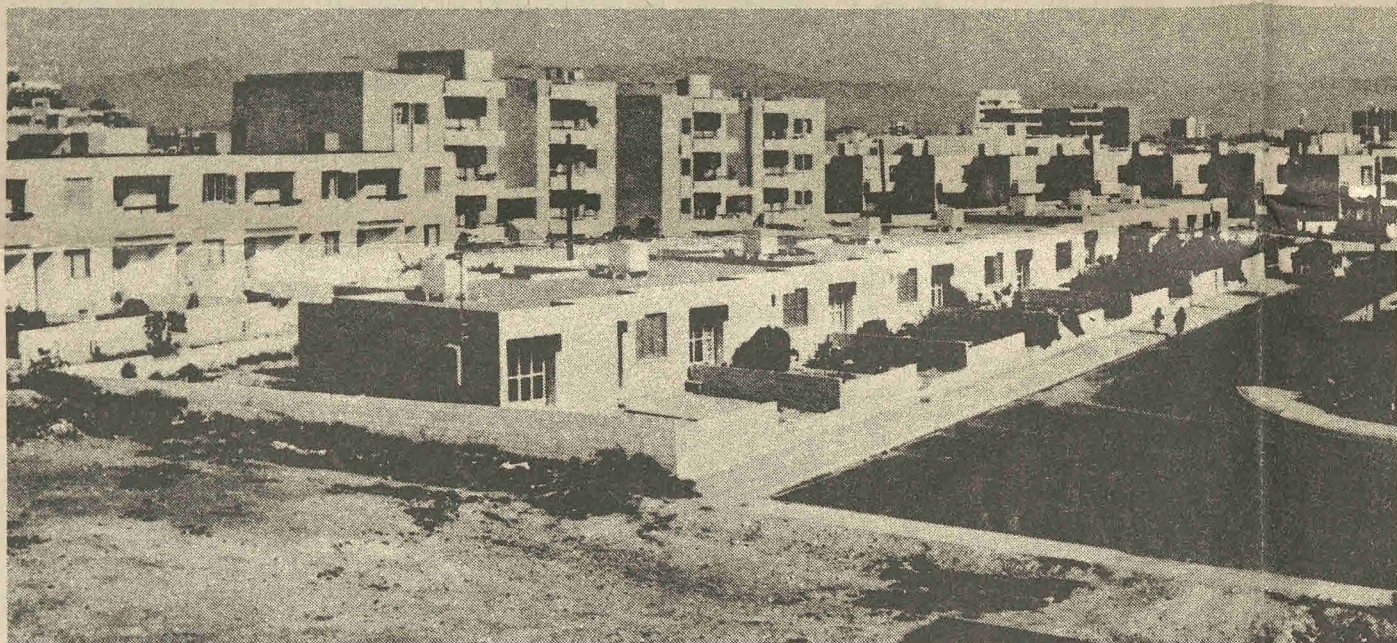
Med den tyrkiske besættelse og deling af Cypern måtte tusinder af græsk-cyprioter fore en tilværelse som flygtninge. I den græsk-cypriotiske del af landet byggedes derfor nye bebyggelser til lave omkostninger. Flygtninge og familier med sociale problemer kom i første række.