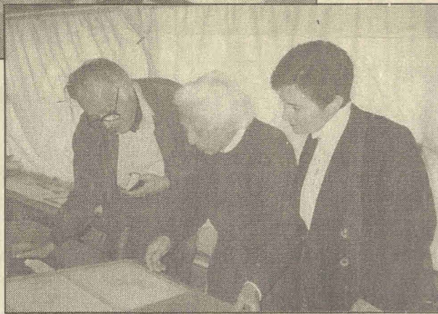
που τον πρόσεχε.

- Είδες μες στην τηλεόραση τις αθλιότητες; - ήταν η πρώτη του ερώτηση.