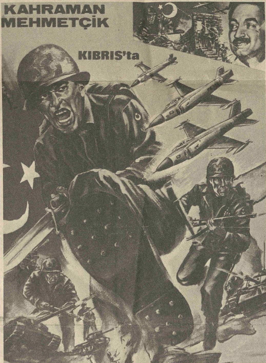
De tyrkiske troppers hærgen på Cypern demonstreres i uhyggelig grad af denne tyrkiske plakate for den såkaldte »Operation fred«

Stærke lande som England, Grækenland og Tyrkiet rev og sled i hver sin del af øen. På et tidspunkt så det ud som om den græske junta ville invadere,