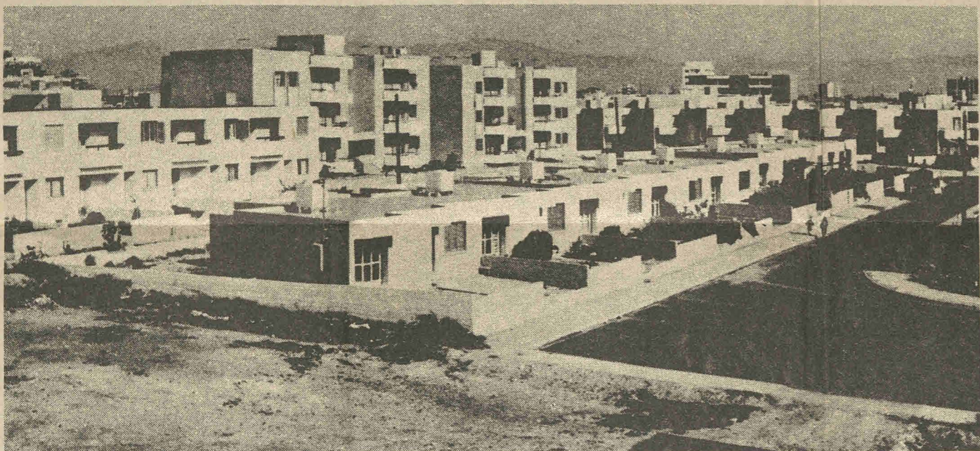
Med den tyrkiske besættelse og deling af Cypern måtte tusinder af græsk-cyprioter føre en tilværelse som flygtninge. I den græsk-cypriotiske del af landet byggedes derfor nye bebyggelser til lave omkostninger. Flygtninge og familier med sociale problemer kom i første række.

Fools-4 klar med nyt broget program..... 8