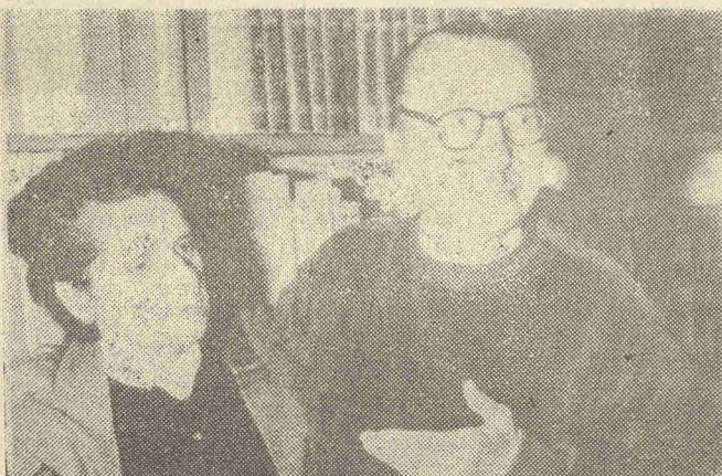
Η κ. Έλενη μαζί με τον Νίκο Καζαντζάκη σε παιλιά φωτογραφία.

—«'Αγαπώ πολύ την Κύπρο, γι' αυτό άλλωστε ήρθα εδώ για να ξεκουραστώ. 'Η θάλασσα σας είναι μαγεία, μου κάνει έντυπωσή το πεντακάθαρο νερό της.