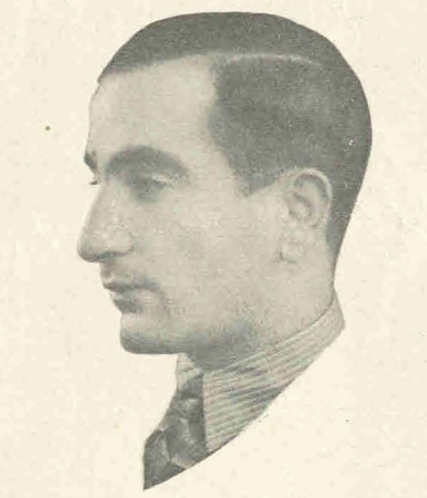
ΜΗΤΣΟΣ ΜΑΡΑΓΚΟΣ, λογοτέχνης