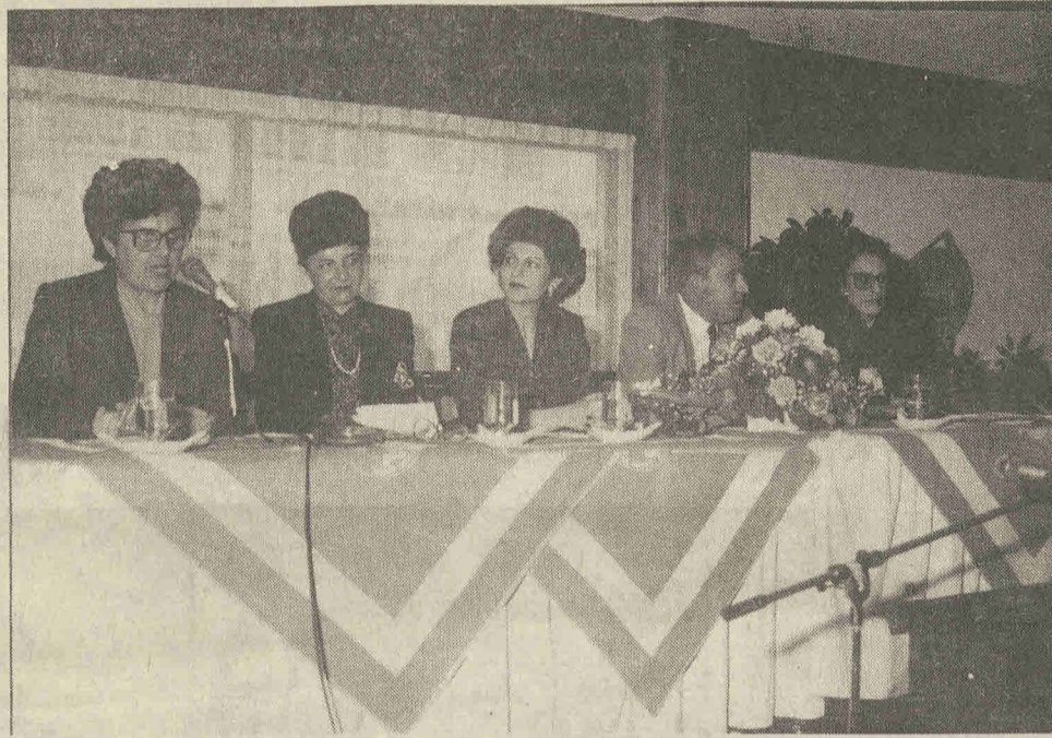
Το Προεδρείο της εκδήλωσης.

«Όσο πιο ψηλούς στόχους θέτει μια κοινωνία, άλλο τόσο ψηλά στέκεται η λογοτεχνία της. Οι απελευθερωτικοί και κοινωνικοί αγώνες, καθώς αναπτύσσονται και προχωρούν στο τελικό τους στόχο, βρίσκουν τον πιο θερμό και ειλικρινή εκφραστή τους στη λογοτεχνία και ειδικότερα στην ποίηση. Συχνά μάλιστα η λογοτεχνία γίνεται η εμπροσθοφυλακή των κοινωνικών, απελευθερωτικών αγώνων, γιατί οι δημιουργοί, με το πνεύμα της δικαιοσύνης που τους διέπει, γίνονται οι πιο θερμοί εκφραστές της. Μέσα από