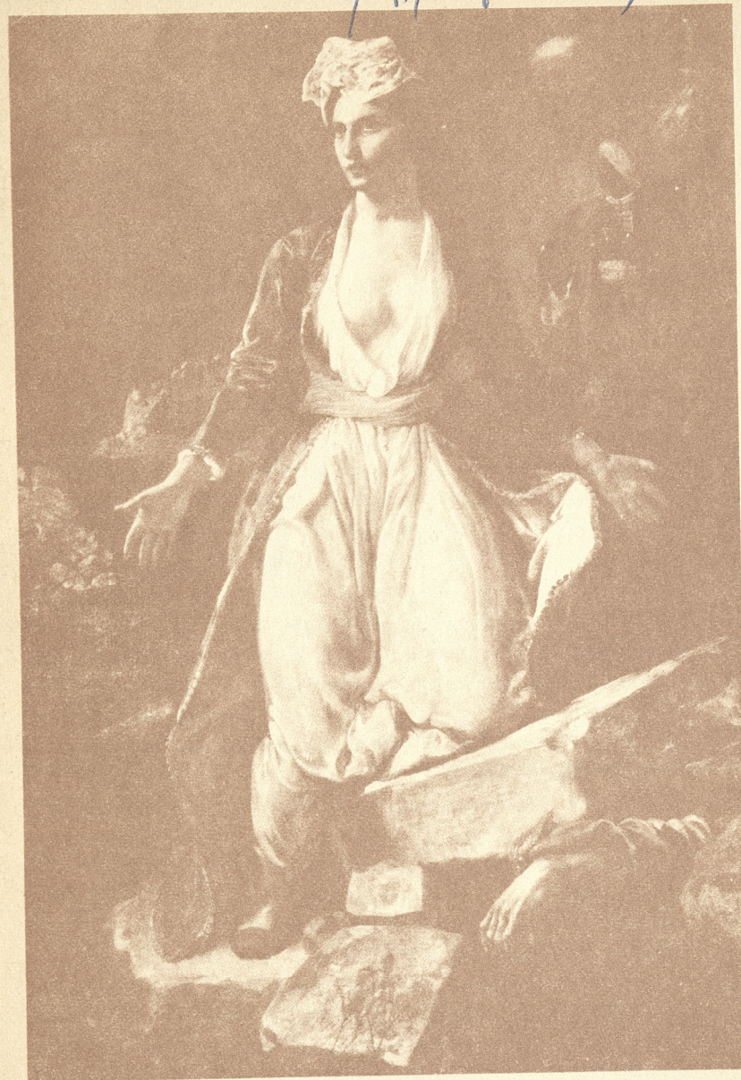
«Η ΕΛΛΑΔΑ ΠΕΘΑΙΝΟΝΤΑΣ ΠΑΝΩ ΣΤΑ ΕΡΕΙΠΙΑ ΤΟΥ ΜΕΣΟΛΟΓΓΙΟΥ». Πίνακας του Ντελακρουά (Μουσείο του Bordeaux).