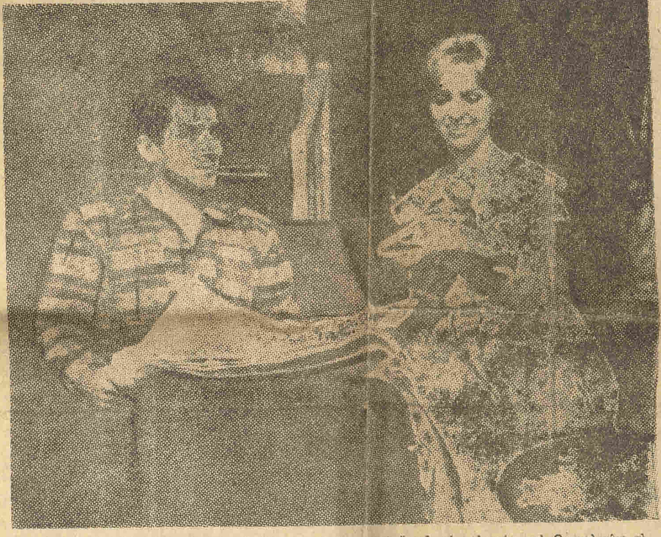
Για σκηνή από το «Καλοκαίρι της 17ης Κούκλας» του Λώρερ, που έπαιξε το καλοκαίρι στη Θεσσαλονίκη το «Θέατρο Τέχνης» του Κερόλου Κούν

ΜΕΣΑ στην καλλιτεχνική ξερσία, που βασίλευσε στη Θεσσαλονίκη, υπάρχουν και μερικές οάσεις, που σκορπούν ανακούφιση κι' ελπίδα. Μία από τις σπουδαιότερες από τις οάσεις αυτές είναι αναμφισβήτητα το Κρατικό Ώδειο Θεσσαλονίκης.