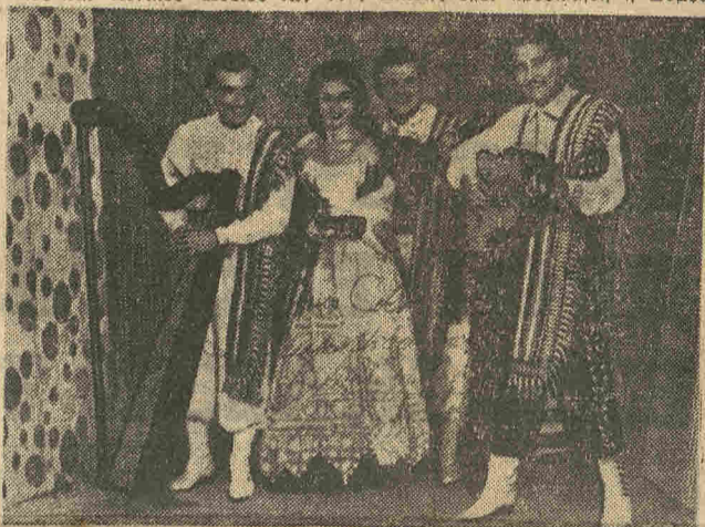
Ἡ Ἀθῆνα ἐξακολουθεῖ νὰ κρατᾷ αἰχμάλωτος τὸ διεθνoῦς φήμης σύνολο «Λὸς Ἰντιος». Τὸ ἐξαιρετὸ συγκρότημα, κατόπιν τῆς ἐξαιρετικῆς ἐπιτυχίας του, ἀνανέωσε τὸ συμβολαίό του μὲ γνωστὸ ἀθηναϊκὸ κέντρο.

« Α πὸ τὶς πρῶτες ἐκδηλώσεις τοῦ Συλλόγου αὐτοῦ θὰ εἶναι ἡ ὀργάνωσις τῶν συναυλιῶν τῆς Κρατικῆς Ὀρχήστρας Ἀθηνῶν, ἡ ἐπίσκεψις τῆς ὁποίας ἔχει ἀποφασισθῆ καὶ θὰ πραγματοποιηθῆ μόλις ὑπερτηθηθῶν ὄρισμένες τεχνικὲς δυσκολίες. Ἐπίσης ἔχει προσκληθῆ ἡ Συμφω-