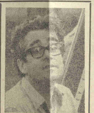
'Ο Μισέλ Δεγκράν, Γάλλος συνθέτης, που γράφει συχνά μουσική για κινηματογραφικές ταινίες. Τελευταία ό Δεγκράν έγραψε μουσική για ταινίες τηλεόρασεως.

Σολίστ: 'Η πιανίστα Άννα Τσίτσα - Κούνιο.