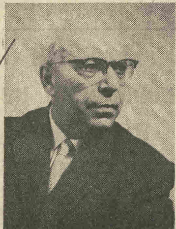
Σόλων Μιχαηλίδης: Ο Κύπριος αρχιμουσικός, που πέθανε χθές.

χουν εκτελεσθεί από την ΚΟΑ, την ΚΟΘ, τις Συμφωνικές της ΕΡΤ, του Μπί-Μπί-Σι, της Γαλλικής, Γερμανικής, Ελβετικής, Ιταλικής, Νορβηγικής και Ρουμανικής Ραδιοηλεκτρικής. Προσκαλέστηκε επανειλημμένα να πάρει μέρος στις κρατικές επιτροπές διεθνών μουσικών διαγωνισμών στην Ουαλλία, Ίταλία, Έλβετία, Βουλγαρία κ.ά. Επί 20 χρόνια (1948—1968) ήταν μέλος του Εκτελεστικού Συμβουλίου της Διεθνούς Έταιρείας Λαϊκής Μουσικής.