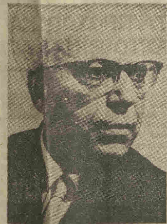
Ο εκλιπών συνθέτης, αρχιμουσικός και μουσικολόγος Σόλωνας Μιχαηλίδης.

Αποφασιστικής σημασίας, καθοριστικός ο ρόλος του — ρόλος εμπνευστή εν πολλοίς — στην