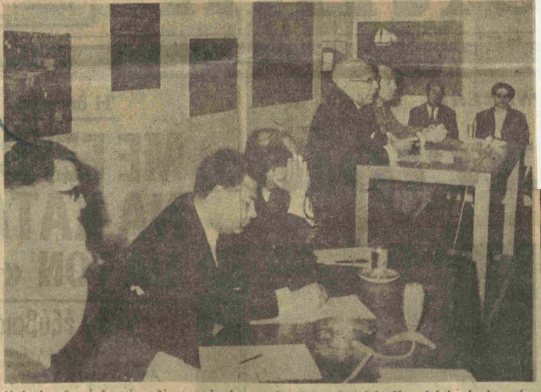
Από την χθεσινή δημόσια συζήτηση για τη μουσική παιδεία στα σχολεία. Μερικοί από τους εισηγητές.