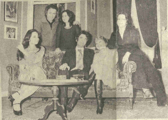
Τελειώνουν σήμερα οι παραστάσεις της «Γλυκειάς Παγίδας» στην «Αύλαια» από τον θίασο Γιάννη Εὐαγγελίδη — Βέτας Προέδρου. Στην φωτογραφία ὅλος ὁ θίασος ἐπὶ σκηνῆς