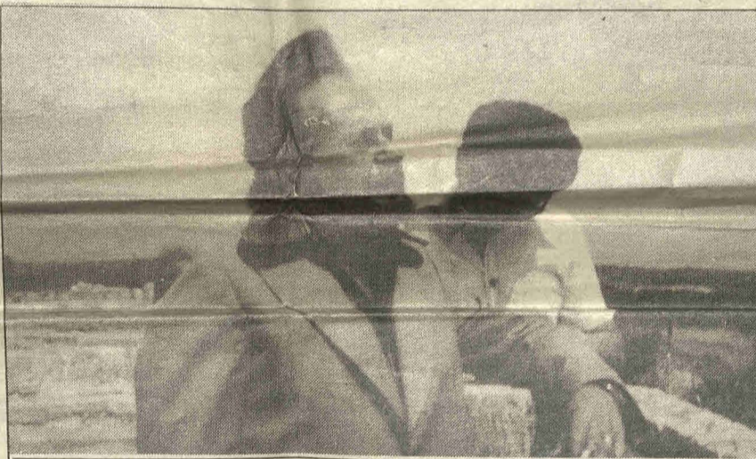
Με τον Γιάννη Ρίτσο στο ναό του Απόλλωνα, κατά την επίσκεψή του ποιητή στην Κύπρο.

ΑΓΩΝΑΣ: Με ὅσα αναφέρατε κ. Παιονίδη, φάνηκε ὅτι συμφωνείτε ὄχι μόνο μαζί μου μα με κάθε ανεξάρτητο ενδιαφερόμενο, στο ὅτι ο ρόλος του ΘΟΚ σαν φορέα θεατρικής ανάπτυξης ἔχει κάπου «ξεφτίσει». Και πώς το ποσό που παίρνει ο ΘΟΚ σαν επιχορήγηση, είναι κατά πολύ