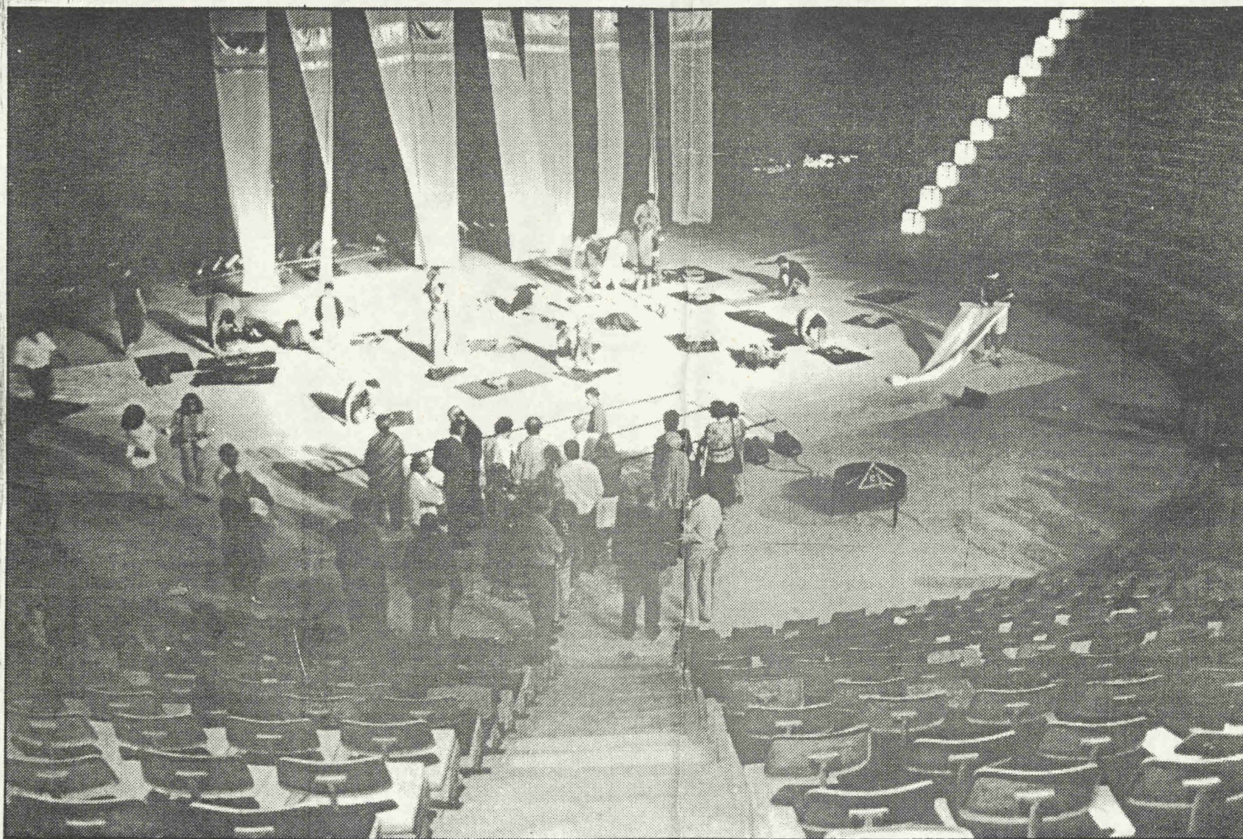
Στιμωτόπο από την παράσταση του έργου «Αχιλλέας», που δόθηκε στις 14 Σεπτεμβρίου, στη Λευκωσία.

ΚΑ ΔΕ ΜΕ ΤΕ ΚΕ ΣΕ ΤΙ ΤΙ Ο ΤΙ Ο Ν Π Ν Κ Ο