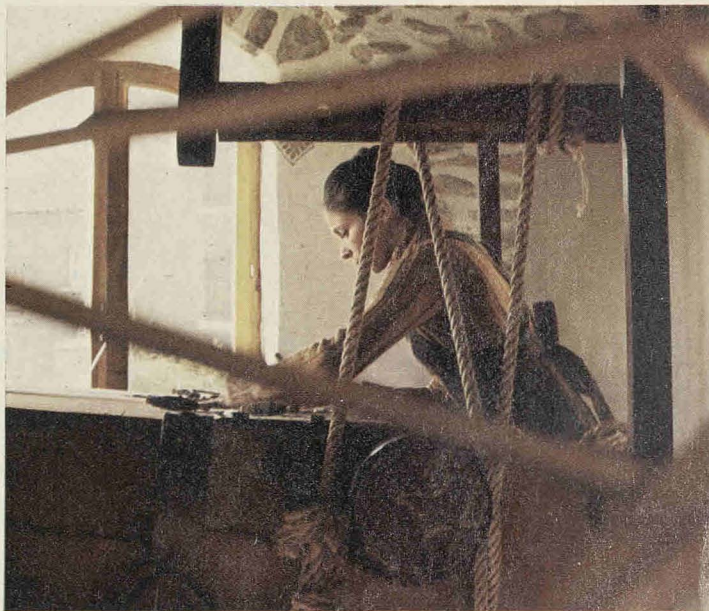
Στόν άργαλειό, όπως οι άνουφάντρες τού παλιού καιρού.