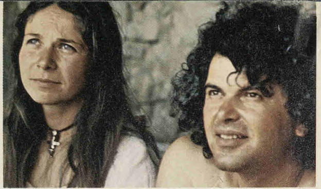
Οι δύο καλλιτέχνες: Τό έργο τους, προσφορά στην Κύπρο.