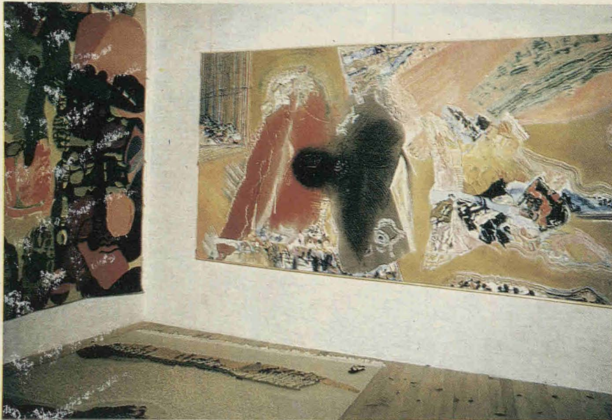
Στο ύπνοδομάτιο συνεχίζεται ή έκθεση, πού πιάνει επίσης και τώ χώρο τού άτελιέ.