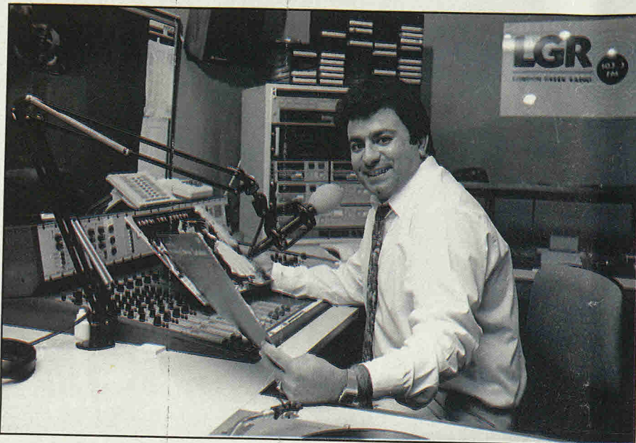
Ο Ελληνικός ραδιοσταθμός του Λονδίνου – LGR – έχει δώσει νέα πνοή στην παροικία.

Ένα οδοιπορικό όμως στο Λονδίνο δεν μπορεί ν' αφήσει εκτός το Θέατρο Τέχνης και τον ιδρυτή κι εμπνευστή του Γιώργο Ευγενίου, που από το 1957 «συμβαδίζει με τον αγώνα της Κύπρου».