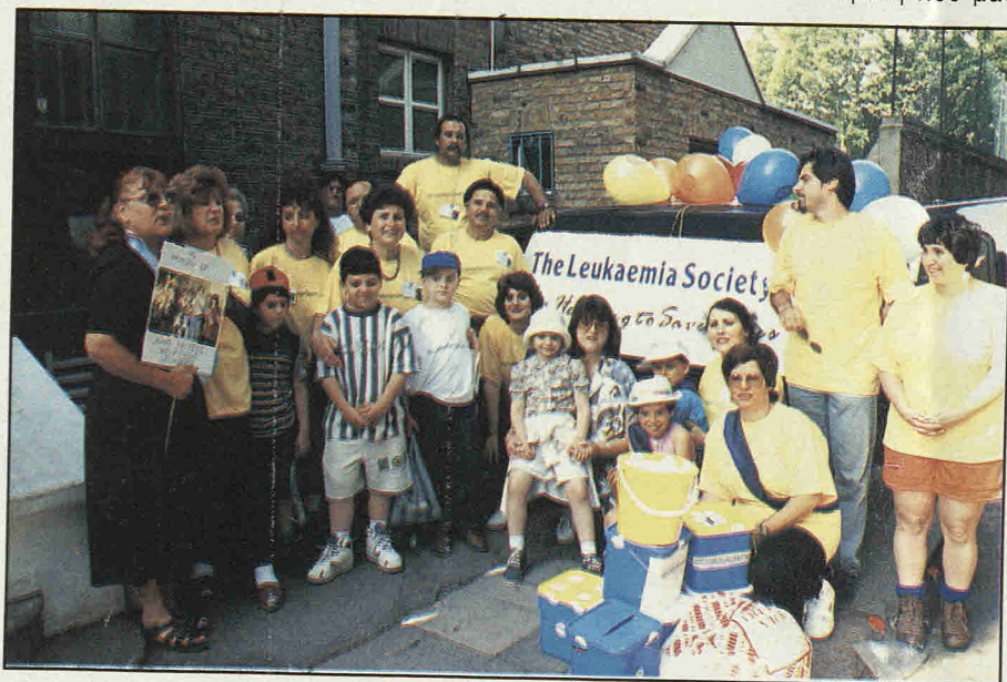
Η παροικία δίνει το παρών της σε φιλανθρωπικές εκδηλώσεις.

Ξεκινώντας από ένα γκαράζ ο Ευγενίου έστησε με τον καιρό ένα στέκι, που δίνει στη ζωή της παροικίας την άλλη της διάσταση, την πολιτιστική. Με ρεπερτόριο βγαλμένο από το αρχαίο ελληνικό δράμα, κι από το σύγχρονο δραματολόγιο Ελλάδας και Κύπρου, προσπαθεί ν' απαντήσει σε ανάγκες πνευματικές, προσπαθεί να συντηρήσει μ' ένα