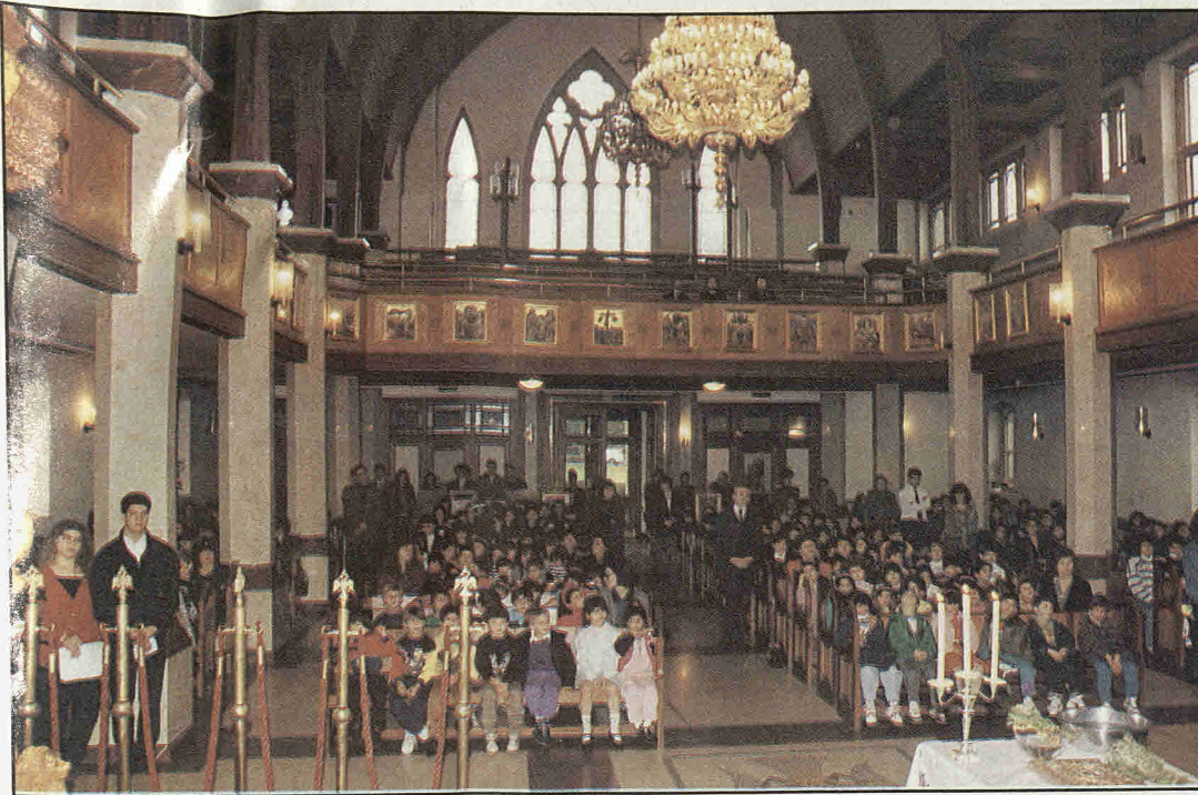
Μια από τις 100 εκκλησίες της παροικίας.