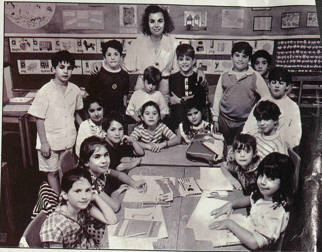
Τα παιδιά της παροικίας μαθαίνουν τη μητρική τους γλώσσα.

Πήγα ένα Σάββατο σ' ένα απ' αυτά τα σχολεία.