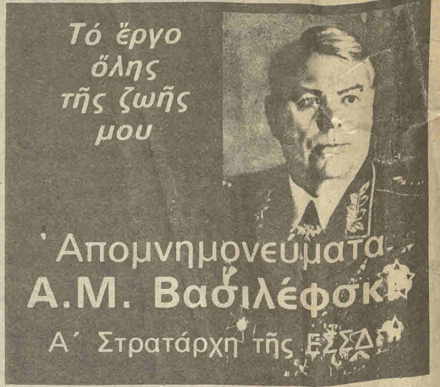
Απομνημονεύματα Α.Μ. Βασιλέφσκι Α' Στρατάρχη τής ΕΣΣΔ

Ευχόμεστε έτσι όπως εύτυχώς ή Λεμεσός κάτω από τήν παλέτα του Σπ. Δ. να εύτυχίσουν και να δρουν τόν πρόσωπο τους κι' άλλες γωνιές τού άραιου αυτού νησιού, που απ' όλοσθε δάληταν να τόν άφανίσουν. Θάνα κι' αυτό μία μορφή αγώνα για τήν επίβιωση τής αγάπηνμένης πατρίδας