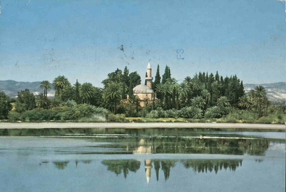
Salt Lake, Tekke, Larnaca, Cyprus.