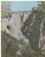
Χαράδρα του Βίκου